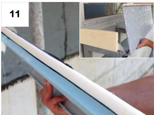
Dichtband anbringen + Schwelle über Tropfnase einhängen