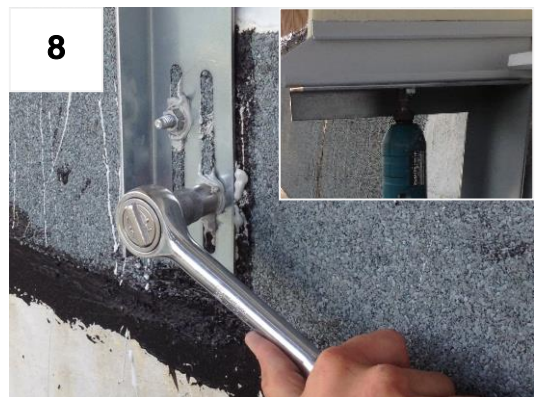
Verstärkungsbügel und Schiene fixieren