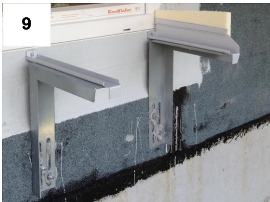
Bei Stütze(n) + Schiene rechts: Punkte 3-8 wiederholen