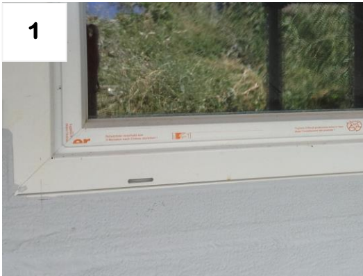
Ausgangslage: Fenstertüre montiert + abgedichtet