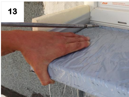
Schwelle „leicht“ anschrauben (muss beweglich bleiben)