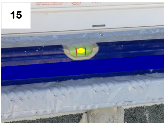
Kontrolle der Montagearbeiten