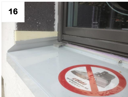
Isolation gemäss Abbildung anschliessen