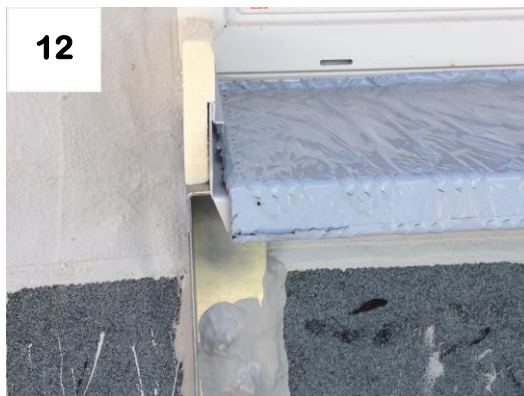
Schwelle zwischen Schienen ausrichten