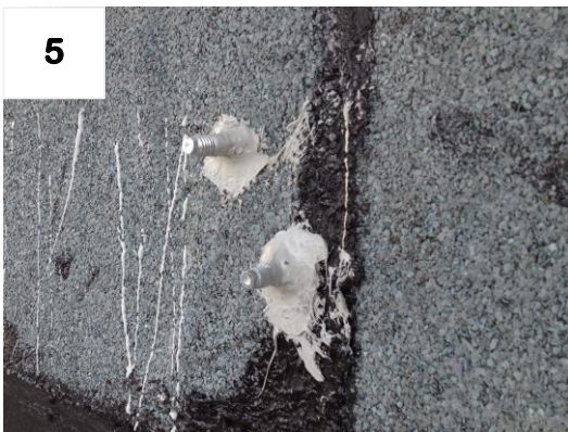
Beide Schlaganker montieren + abdichten