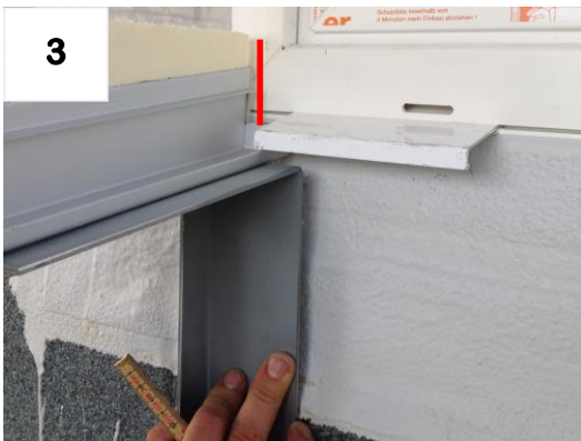
Montagehöhe mit Weterschenkel definieren + Bohrungen anzeichnen