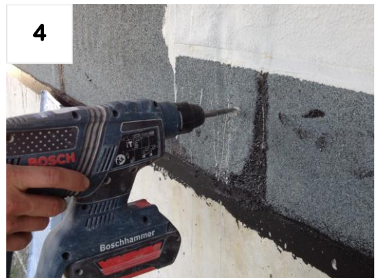
Angezeichnete Montagelöcher bohren