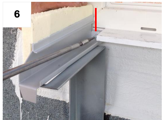
Schiene an Fensterrahmen schrauben