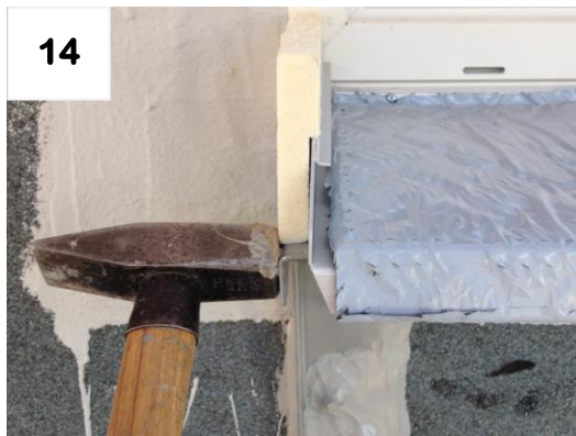
Schienen ausrichten (90° zum Fenster)